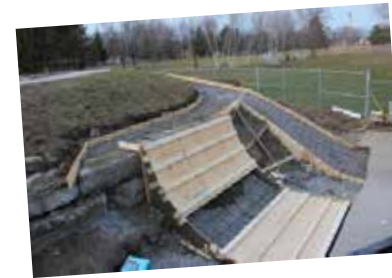
Photo prise durant les travaux